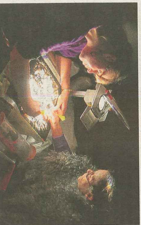
Sur le rétroprojecteur, le décor se crée au fil du spectacle.