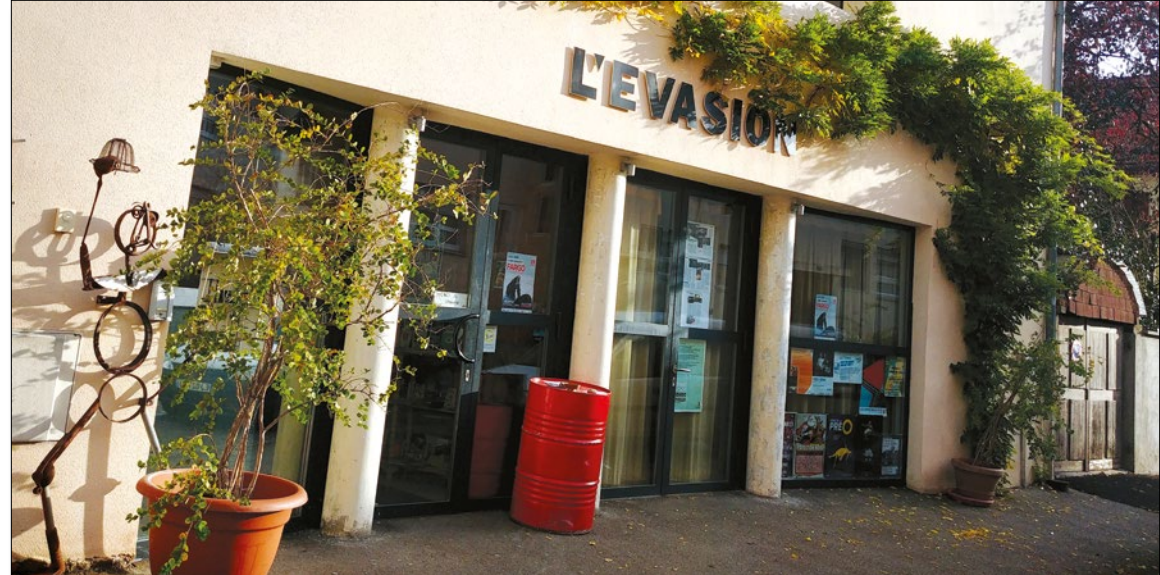
Création du livret: Françoise Digel / L'Évasion | Photographies: P-Mod et L'Évasion.

Depuis sa création, le projet de L'Évasion n'a cessé de s'étoffer. Il englobe aujourd'hui : la Compagnie de L'Évasion , l' Atelier graphique et plastique , trois formations musicales ( Sirocco , quintet de jazz, Sepia Mambo , chansons humoristiques rétro-acoustiques, et Cachou-Cachou , reprises et compos pop métissées), un Espace d'échanges culturels proposant une programmation saisonnière originale, le festival biennal Charivari! et, depuis peu, un Centre de ressources culture et handicap .