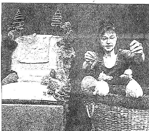
Les Zanimos, avec Pas si bêtes , ce mercredi 31 juillet, à 17 h.

www.leszanimos.com www.les-arts-pitres.com