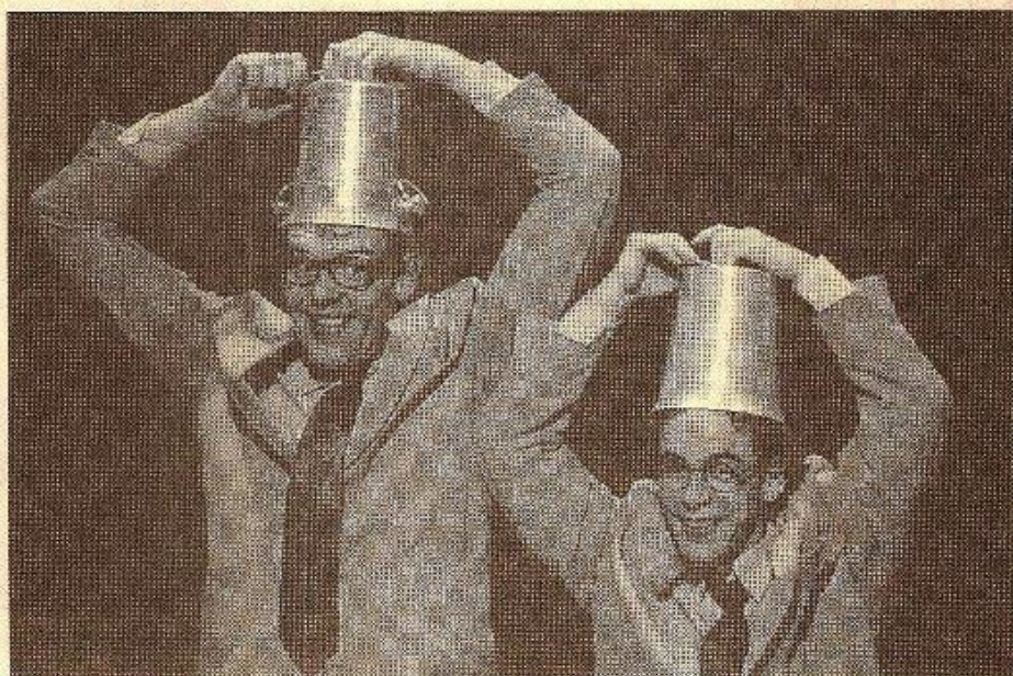
Sur scène, Klonk et Lelonk portent le même costume.

■ Absurde n'est pas français. Du moins, ça en a tout l'air. Car depuis une vingtaine d'années, l'humour français cherche plutôt le bon mot ou la situation vaudevillesque. En oubliant qu'il pouvait y avoir du sens même dans l'absence de sens. Un genre d'humour brutal prescrit pour les situations désespérées, qui révèle les limites d'une rationalité fatalement incomplète. Les Anglo-saxons en sont fous, la communauté juive l'a plus ou moins inventé, les Belges en ont fait leur pain blanc. A Strasbourg, deux pitres s'y adonnent à leur façon. Et se gagnent doucement une belle reconnaissance, après avoir joué aux Pisteurs d'étoiles à Obernai, puis au Théâtre du Rond-Point à Paris.